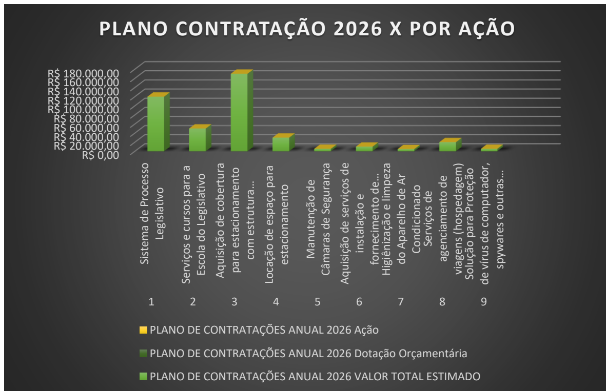
GRÁFICO DO PLANO DE CONTRATAÇÃO 2026